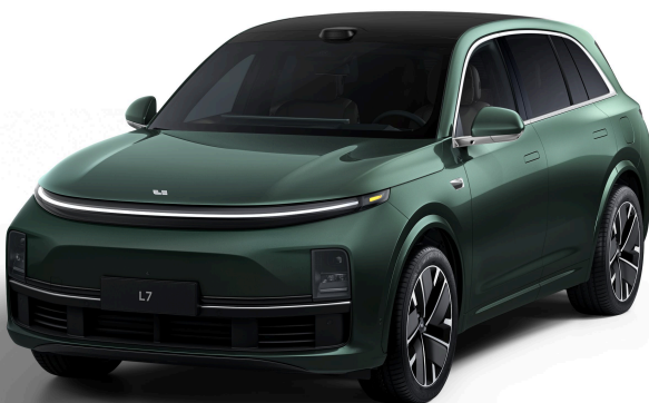
Глубокий зелёный перламутровый - Особая серия 1