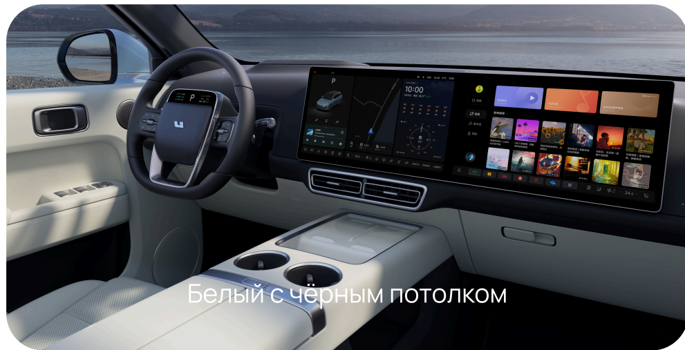
Белый с чёрным потолком