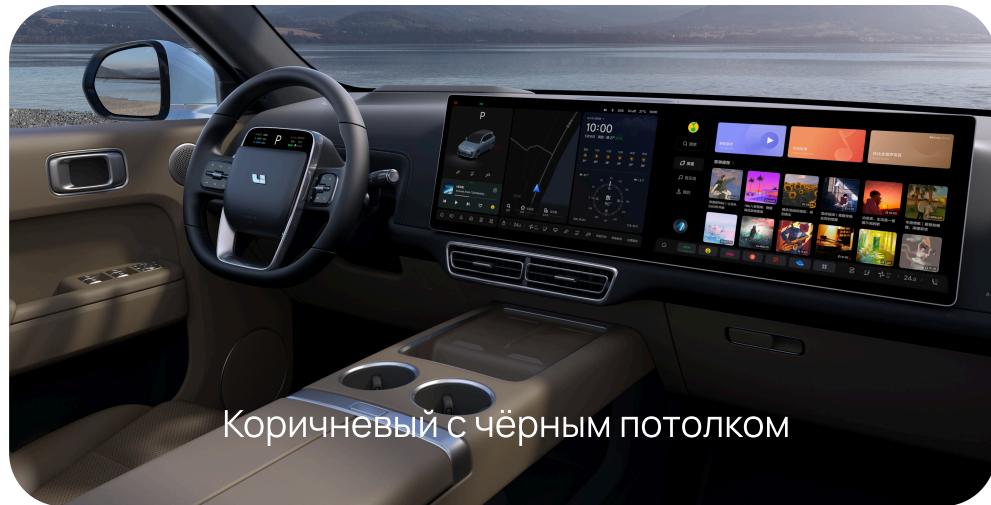
Коричневый с чёрным потолком