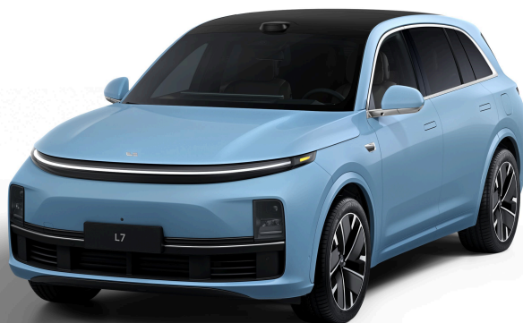
Голубой перламутровый - Особая серия 1