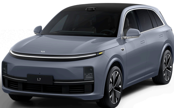
Серо-голубой - Особая серия 1