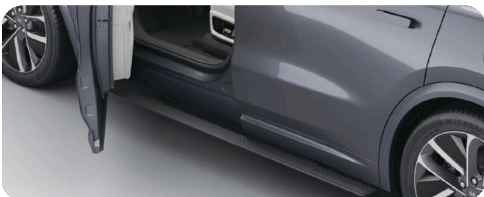
Выдвижные пороги с электроприводом 2

Легкосплавные колёсные диски чёрно-серого цвета